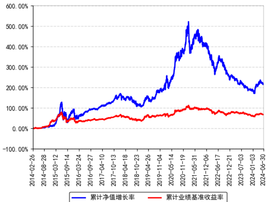
南方新优享灵活配置混合A累计净值增长率与同期业绩比较基准收益率的历史走势对比图