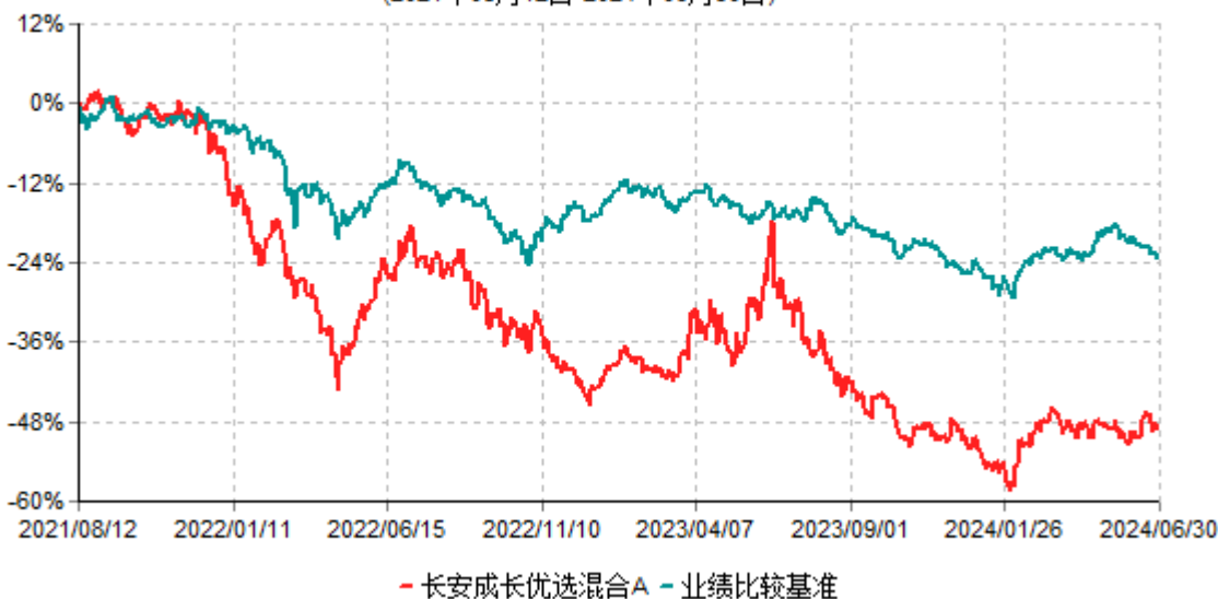
长安成长优选混合A累计净值增长率与业绩比较基准收益率历史走势对比图 (2021年08月12日-2024年06月30日)

根据基金合同的规定,自基金合同生效之日起 6 个月内基金各项资产配置比例需符合基金合同要求。本基金在建仓期结束后,各项资产配置比例已符合基金合同有关投资比例的约定。基金合同生效日至报告期末,本基金运作时间已满一年。图示日期为 2021 年 08 月 12 日至 2024 年 06 月 30 日。