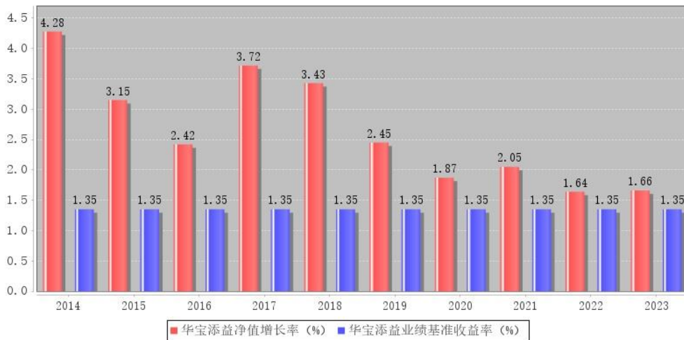
华宝添益每年净值增长率与同期业绩比较基准收益率的对比图