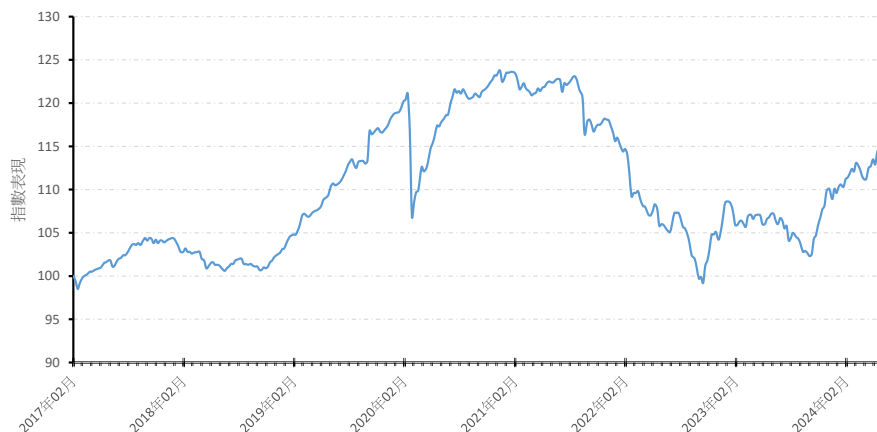
A 美元 (累積)