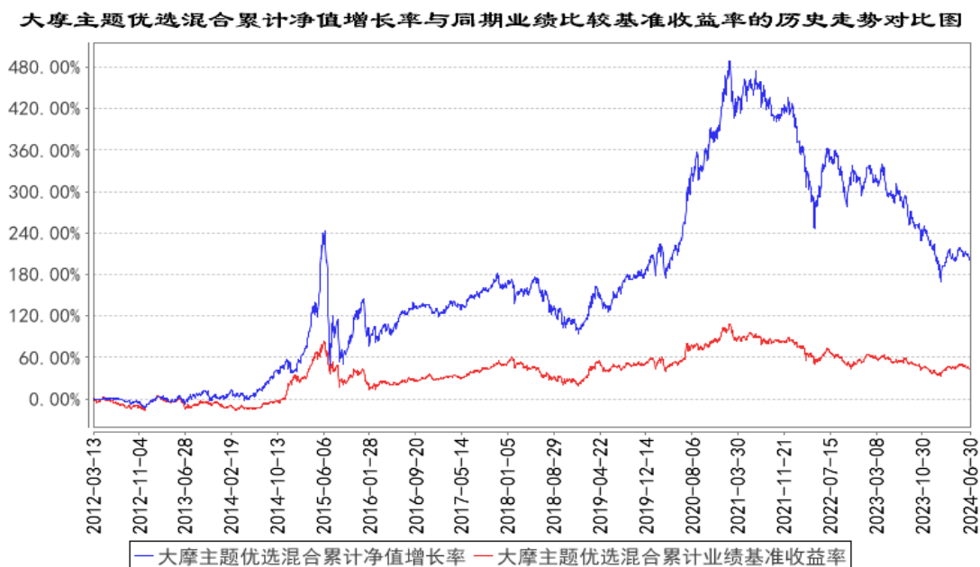
累计净值增长率与业绩比较基准收益率的历史走势对比图： （2012年3月13日至2024年6月30日）

注：本基金基金合同于 2012 年 3 月 13 日正式生效。按照本基金基金合同的规定，基金管理人自基金合同生效之日起 6 个月内使基金的投资组合比例符合基金合同的有关约定。建仓期结束时本基金的投资组合比例符合基金合同的有关约定。