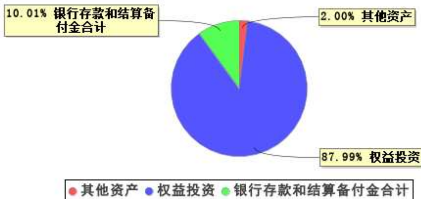
投资组合资产配置图表 (2024年6月30日)