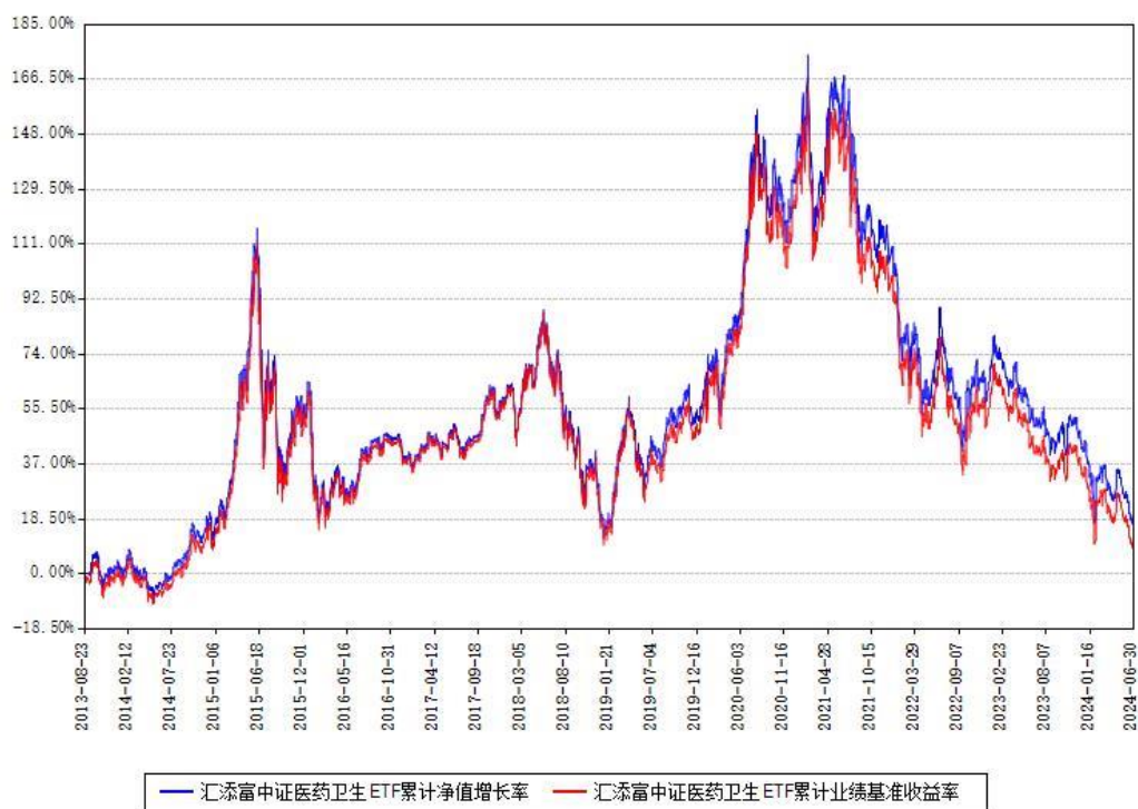
汇添富中证医药卫生ETF累计净值增长率与同期业绩基准收益率对比图