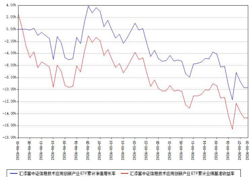
汇添富中证信息技术应用创新产业ETF累计净值增长率与同期业绩基准收益率对比图

(二) 自基金合同生效以来基金累计净值增长率变动及其与同期业绩比较基准收益率变动的比较图