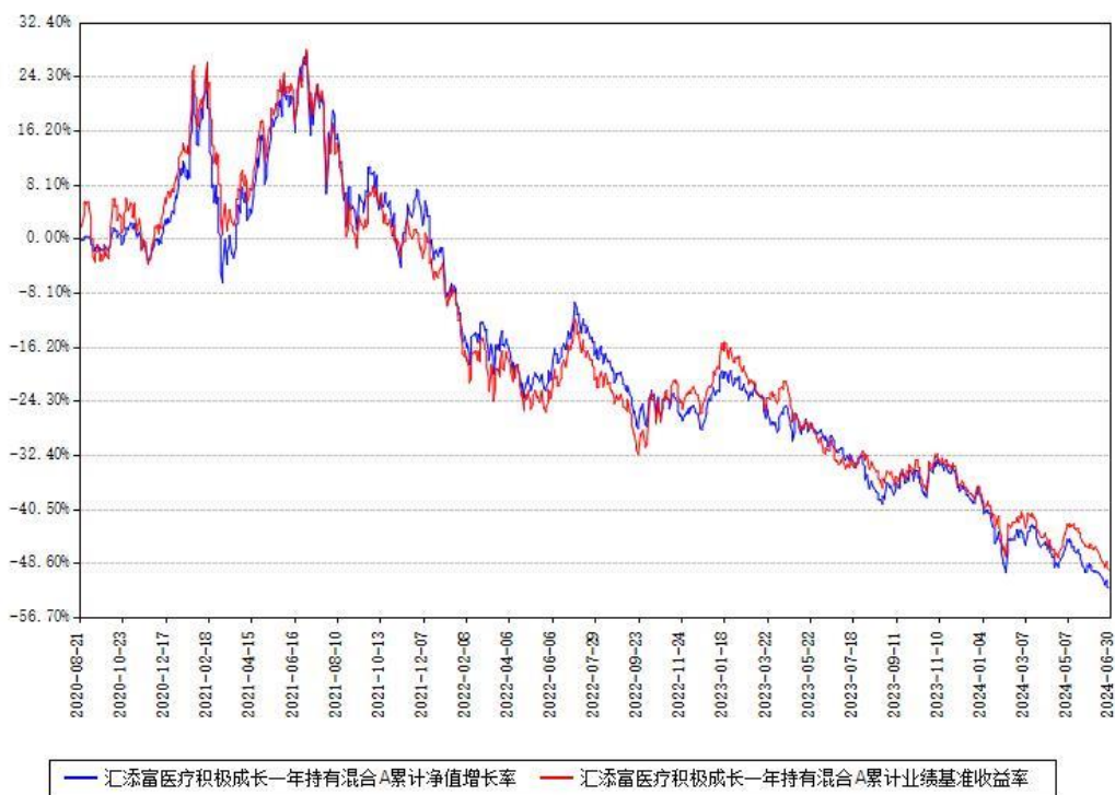
汇添富医疗积极成长一年持有混合A累计净值增长率与同期业绩基准收益率对比图