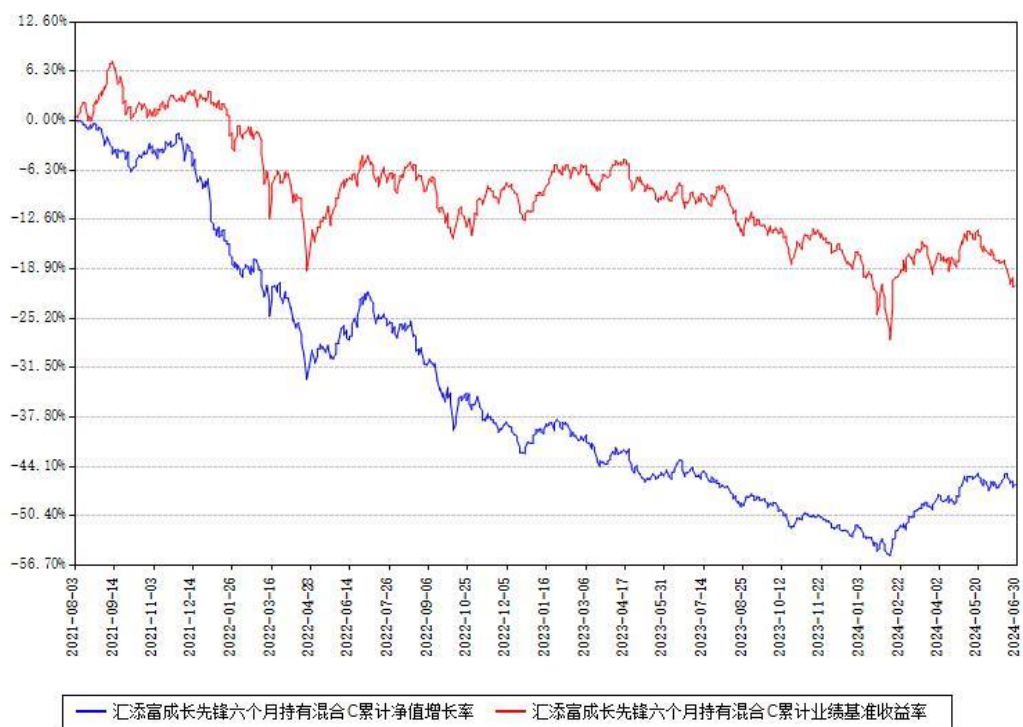
汇添富成长先锋六个月持有混合C累计净值增长率与同期业绩基准收益率对比图