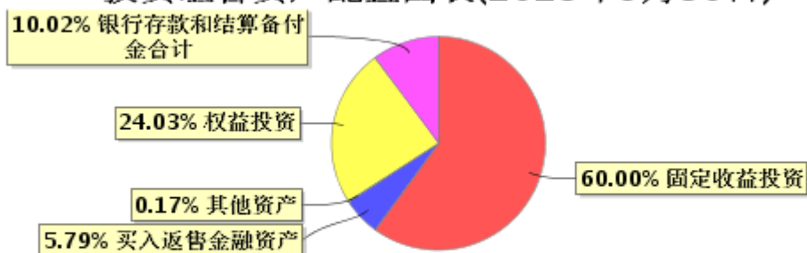
投资组合资产配置图表(2023年9月30日)

● 固定收益投资 ● 买入返售金融资产 ● 其他资产 ● 权益投资 ● 银行存款和结算备付金合计