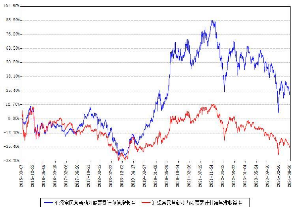
汇添富民营新动力股票累计净值增长率与同期业绩基准收益率对比图