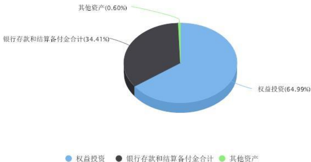
投资组合资产配置图表 数据截止日期:2024年06月30日