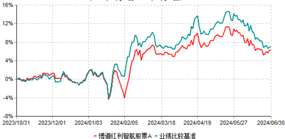
博道红利智航股票A累计净值增长率与业绩比较基准收益率历史走势对比图 (2023年10月31日-2024年06月30日)

注：本基金基金合同生效日为2023年10月31日，建仓期为自基金合同生效日起的6个月。基金合同生效日至报告期期末，本基金运作时间未满一年。截至建仓期结束，本基金各项资产配置比例符合基金合同及招募说明书有关投资比例的约定。