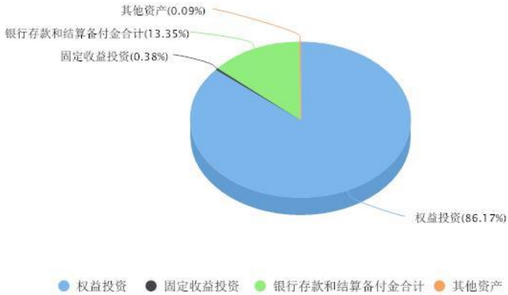
投资组合资产配置图表 数据截止日期:2024年06月30日