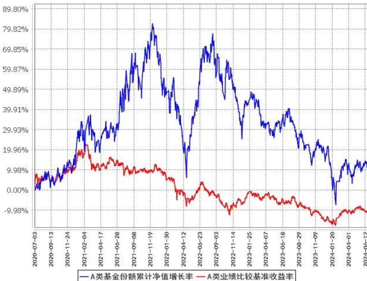
A类基金份额累计净值增长率与同期业绩比较基准收益率的历史走势对比图 (2020年7月3日至2024年6月30日)