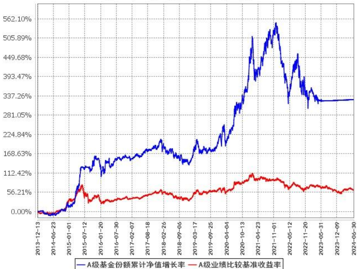
A级基金份额累计净值增长率与同期业绩比较基准收益率的历史走势对比图 (2013年12月13日至2024年6月30日)