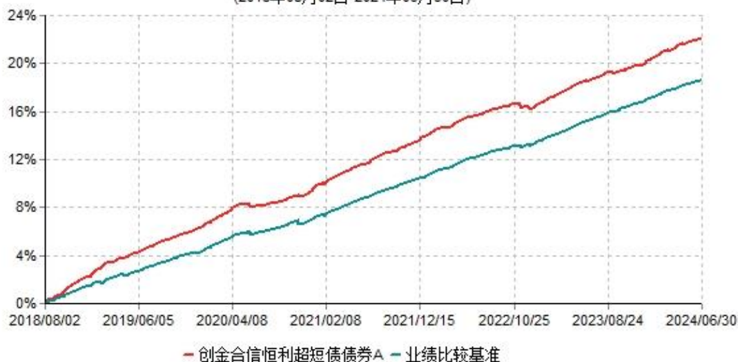
创金合信恒利超短债债券A累计净值增长率与业绩比较基准收益率历史走势对比图 (2018年08月02日-2024年06月30日)