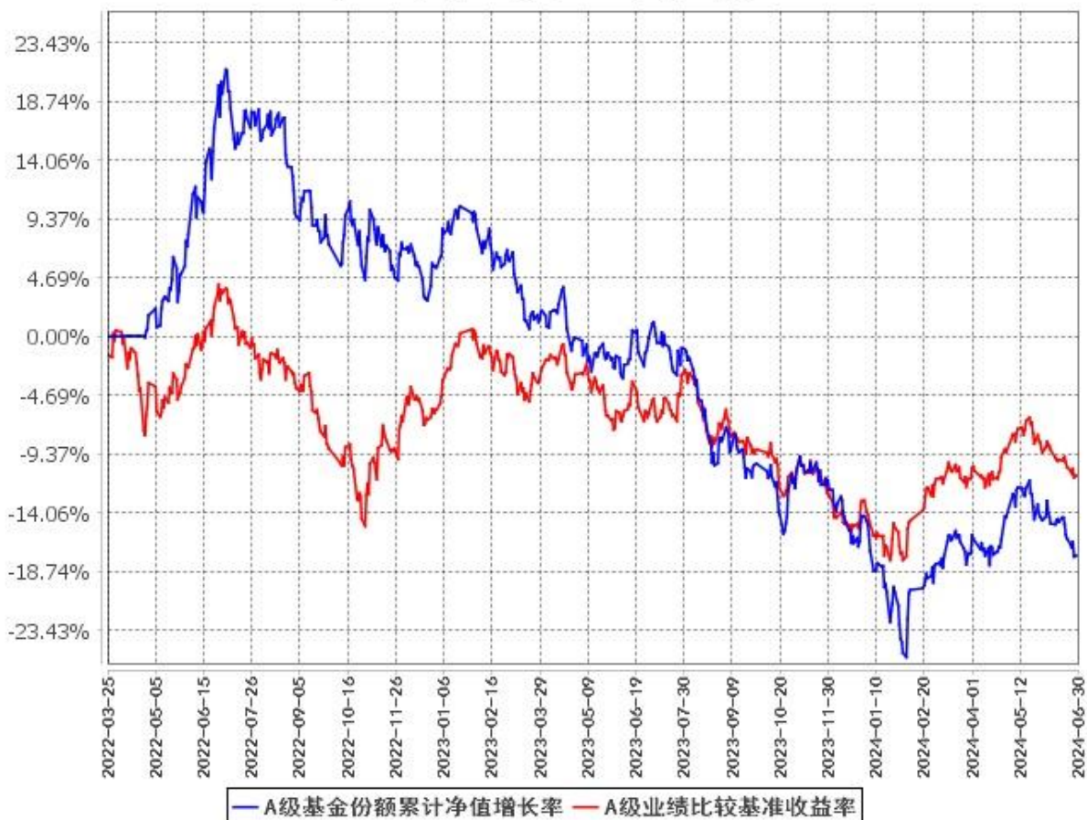
A级基金份额累计净值增长率与同期业绩比较基准收益率的历史走势对比图 (2022年3月25日至2024年6月30日)