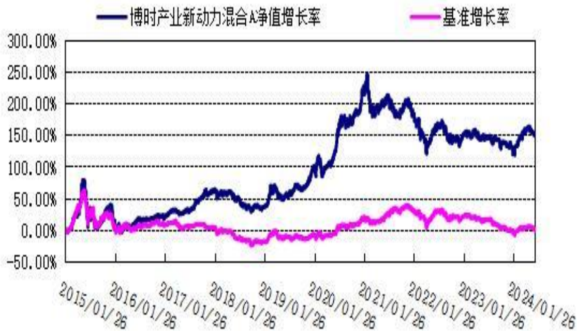
博时产业新动力混合 C