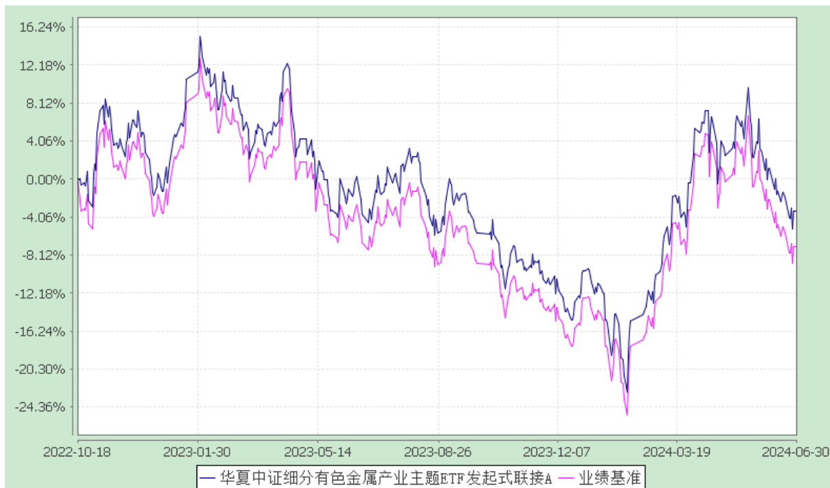
华夏中证细分有色金属产业主题 ETF 发起式联接 C