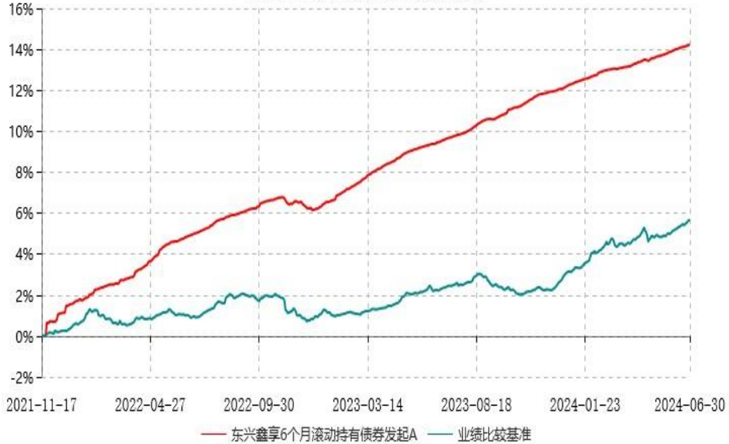
东兴鑫享6个月滚动持有债券发起A累计净值增长率与业绩比较基准收益率历史走势对比图 (2021年11月17日-2024年06月30日)