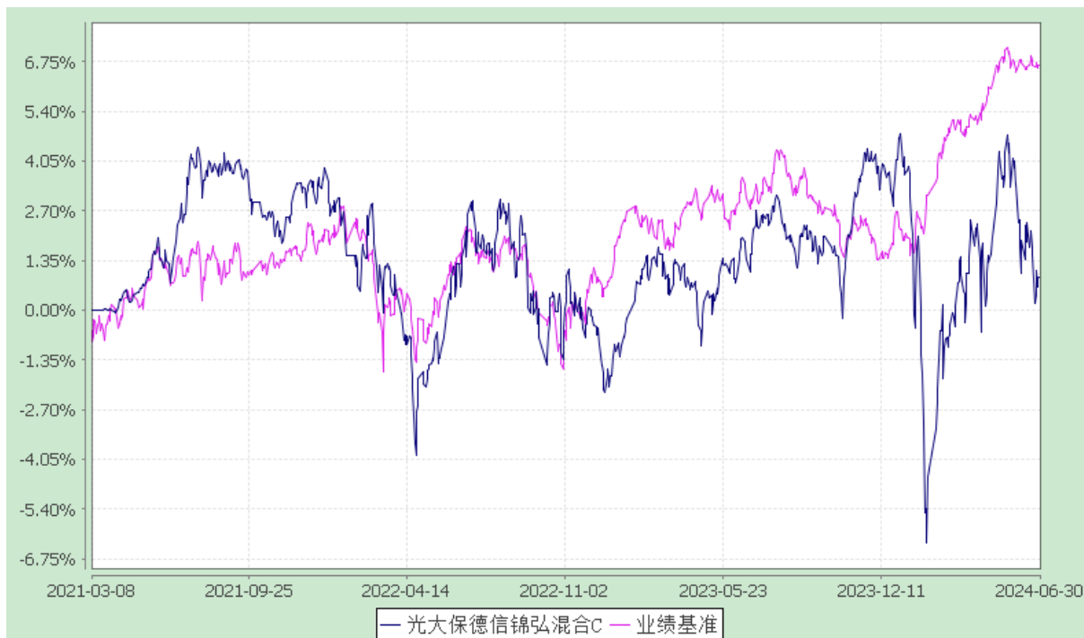
光大保德信锦弘混合 E