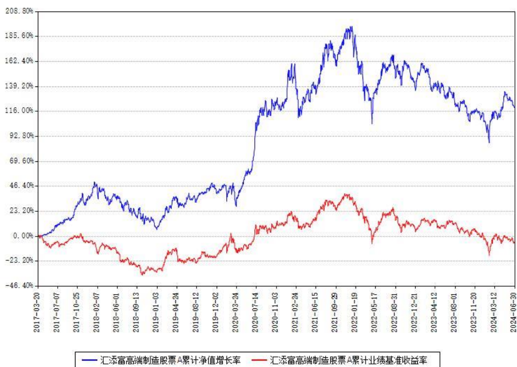
汇添富高端制造股票A累计净值增长率与同期业绩比较基准收益率对比图