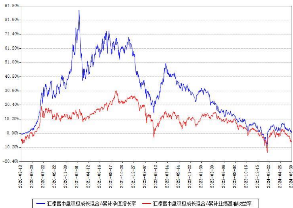
汇添富中盘积极成长混合A累计净值增长率与同期业绩基准收益率对比图