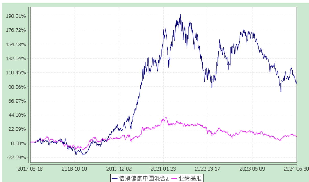
信澳健康中国混合 C 累计净值增长率与业绩比较基准收益率的历史走势对比图