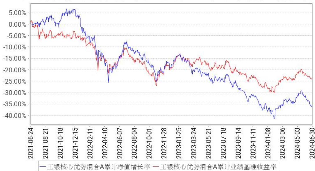
工银核心优势混合A累计净值增长率与同期业绩比较基准收益率的历史走势对比图