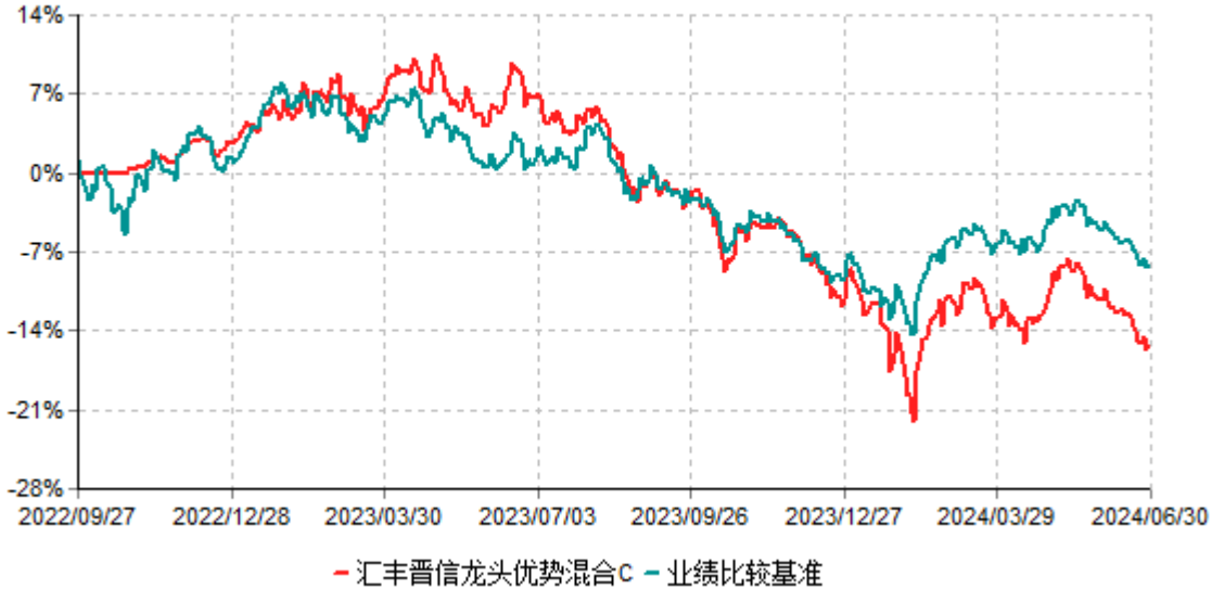
汇丰晋信龙头优势混合C累计净值增长率与业绩比较基准收益率历史走势对比图 (2022年09月27日-2024年06月30日)