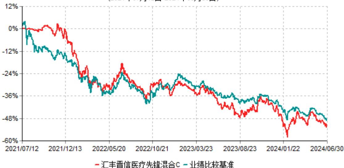
汇丰晋信医疗先锋混合C累计净值增长率与业绩比较基准收益率历史走势对比图 (2021年07月12日-2024年06月30日)