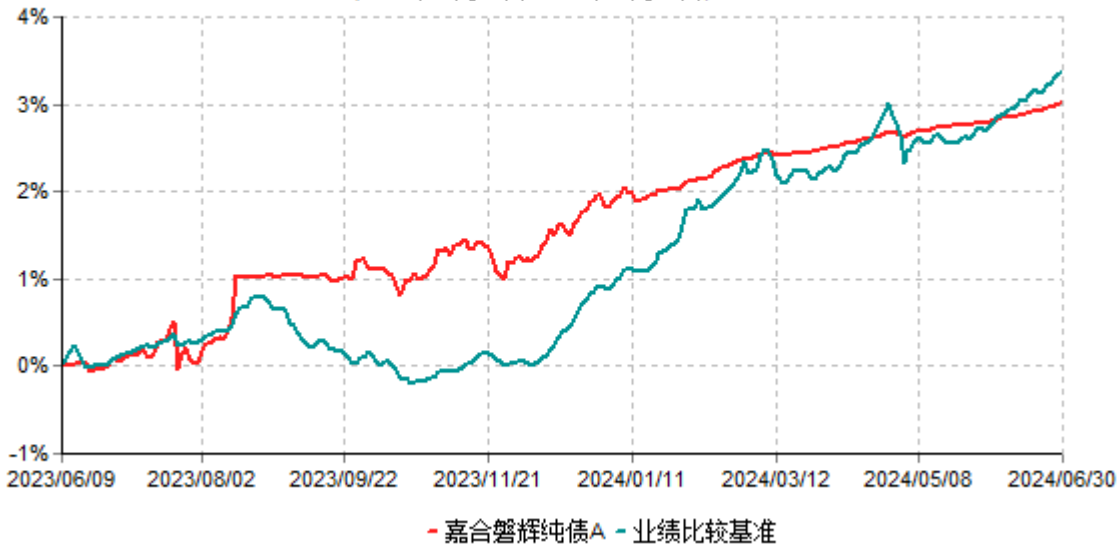
嘉合磐辉纯债A累计净值增长率与业绩比较基准收益率历史走势对比图 (2023年06月09日-2024年06月30日)

注：本基金合同于2023年06月09日生效，按基金合同规定，本基金自合同生效起6个月内为建仓期。建仓期结束时，本基金的各项资产配置比例符合基金合同约定。