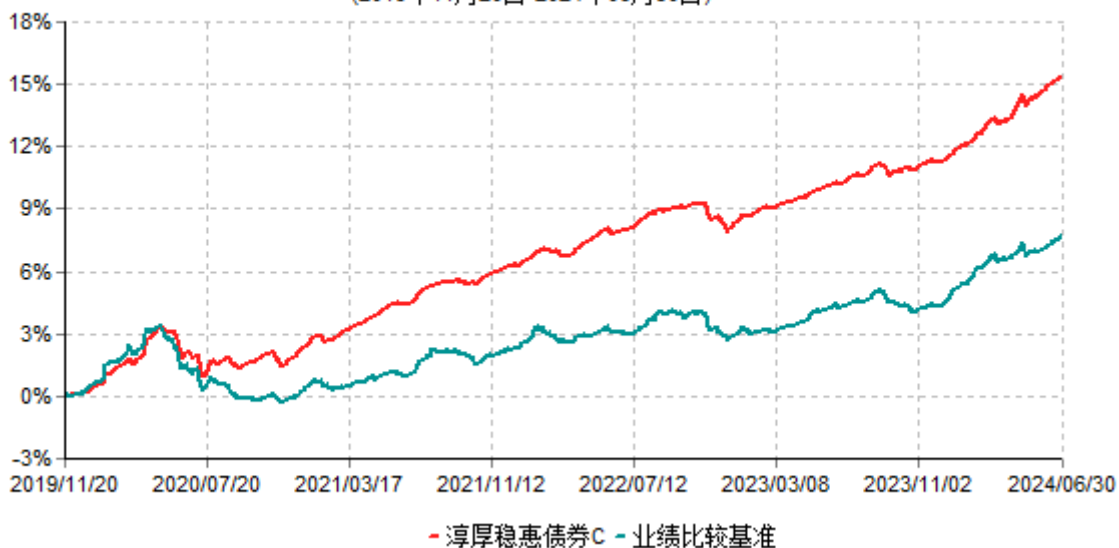
淳厚稳惠债券C累计净值增长率与业绩比较基准收益率历史走势对比图 (2019年11月20日-2024年06月30日)

注：本基金基金合同生效日为2019年11月20日。按基金合同约定，本基金自基金合同生效起6个月内为建仓期。建仓期结束时本基金的各项投资比例均符合基金合同约定。