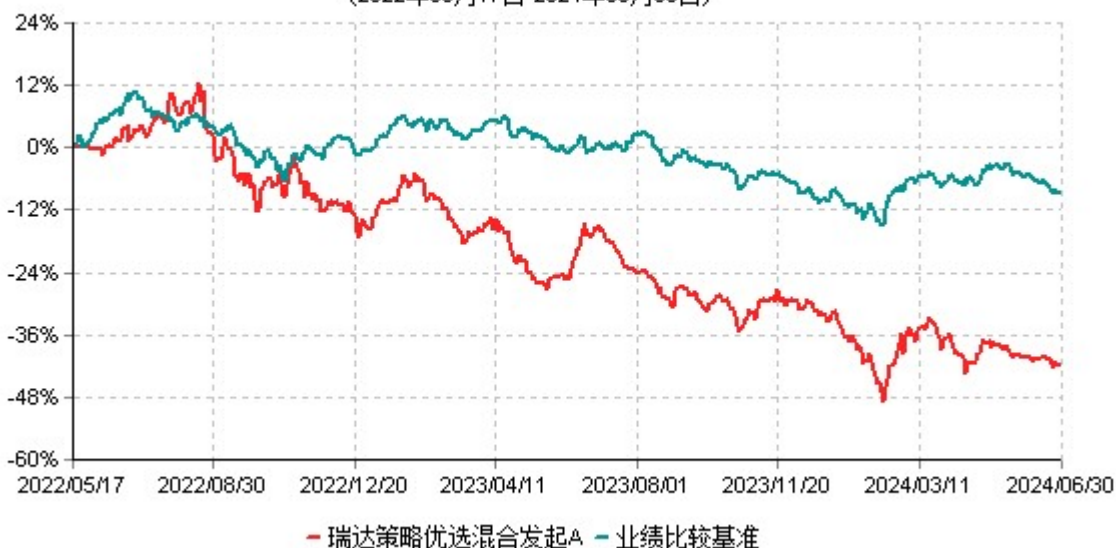
瑞达策略优选混合发起A累计净值增长率与业绩比较基准收益率历史走势对比图 (2022年05月17日-2024年06月30日)