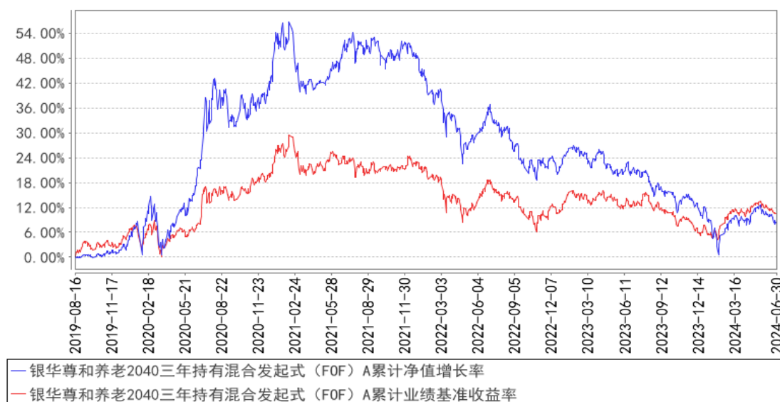
银华尊和养老2040三年持有混合发起式 (FOF) A累计净值增长率与同期业绩比较基准收益率的历史走势对比图