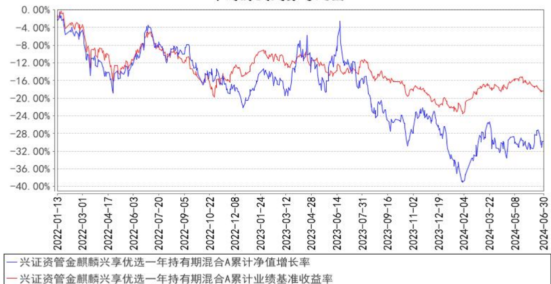
兴证资管麒麟兴享优选一年持有期混合A累计净值增长率与同期业绩比较基准收益率的历史走势对比图