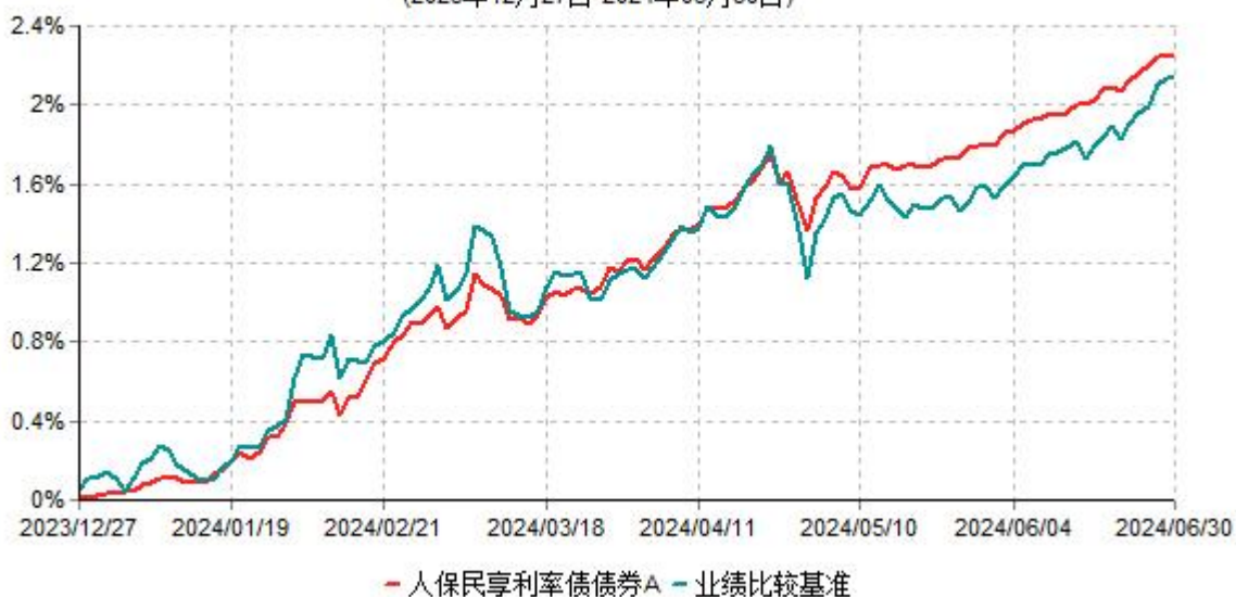
人保民享利率债债券A累计净值增长率与业绩比较基准收益率历史走势对比图 (2023年12月27日-2024年06月30日)