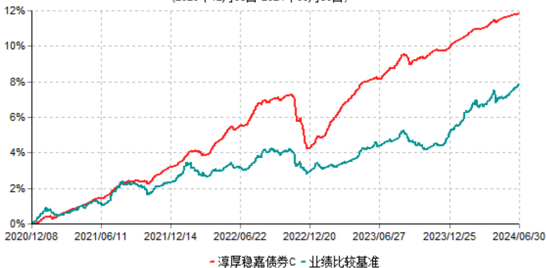
淳厚稳嘉债券C累计净值增长率与业绩比较基准收益率历史走势对比图 (2020年12月08日-2024年06月30日)

注：本基金基金合同生效日为2020年12月8日。按基金合同规定，本基金自基金合同生效起6个月内为建仓期。建仓期结束时本基金的各项投资比例均符合基金合同约定。