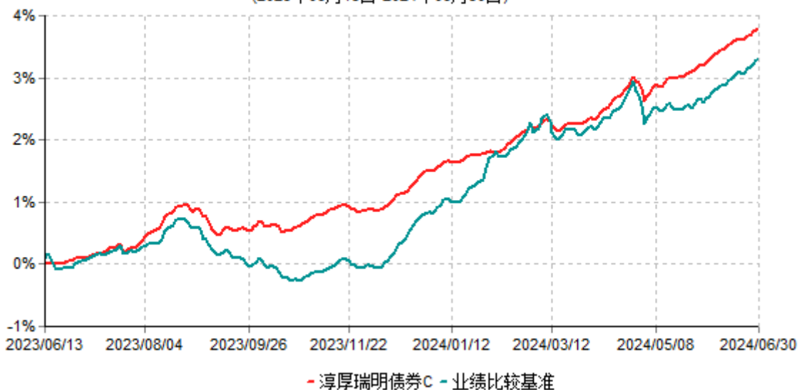
淳厚瑞明债券C累计净值增长率与业绩比较基准收益率历史走势对比图 (2023年06月13日-2024年06月30日)

注：本基金基金合同生效日为2023年06月13日。按基金合同规定，本基金自基金合同生效起6个月内为建仓期。建仓期结束时本基金的各项投资比例均符合基金合同约定。