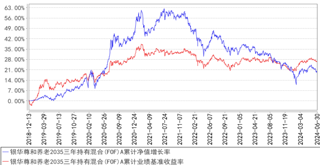
银华尊和养老2035三年持有混合(FOF) A累计净值增长率与同期业绩比较基准收益率的历史走势对比图