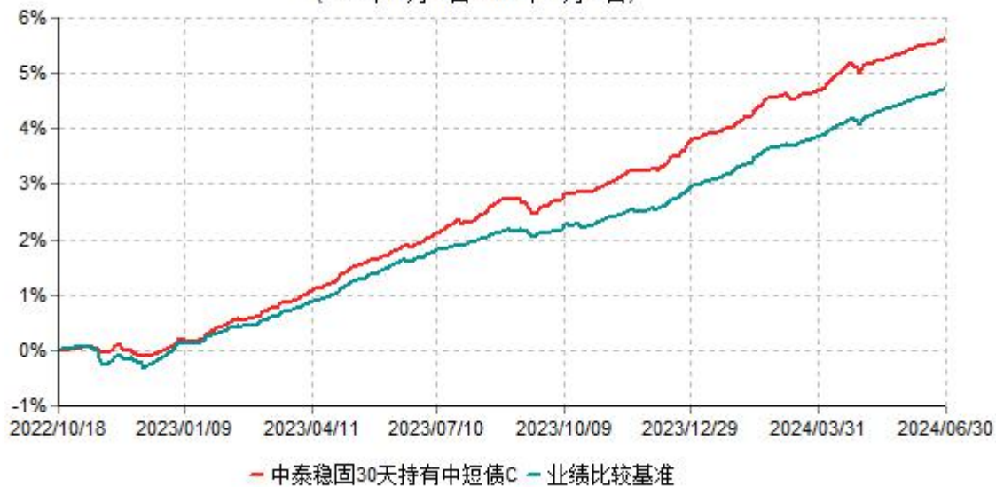
中泰稳固30天持有期中短债C累计净值增长率与业绩比较基准收益率历史走势对比图 (2022年10月18日-2024年06月30日)