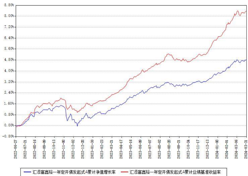
汇添富鑫裕一年定开债发起式A累计净值增长率与同期业绩基准收益率对比图