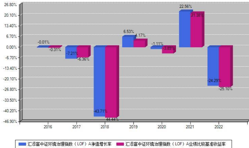
汇添富中证环境治理指数 (LOF) A 每年净值增长率与同期业绩基准收益率对比图

注：数据截止日期为2022年12月31日，基金的过往业绩不代表未来表现。本《基金合同》生效之日为2016年12月29日，合同生效当年按实际存续期计算，不按整个自然年度进行折算。