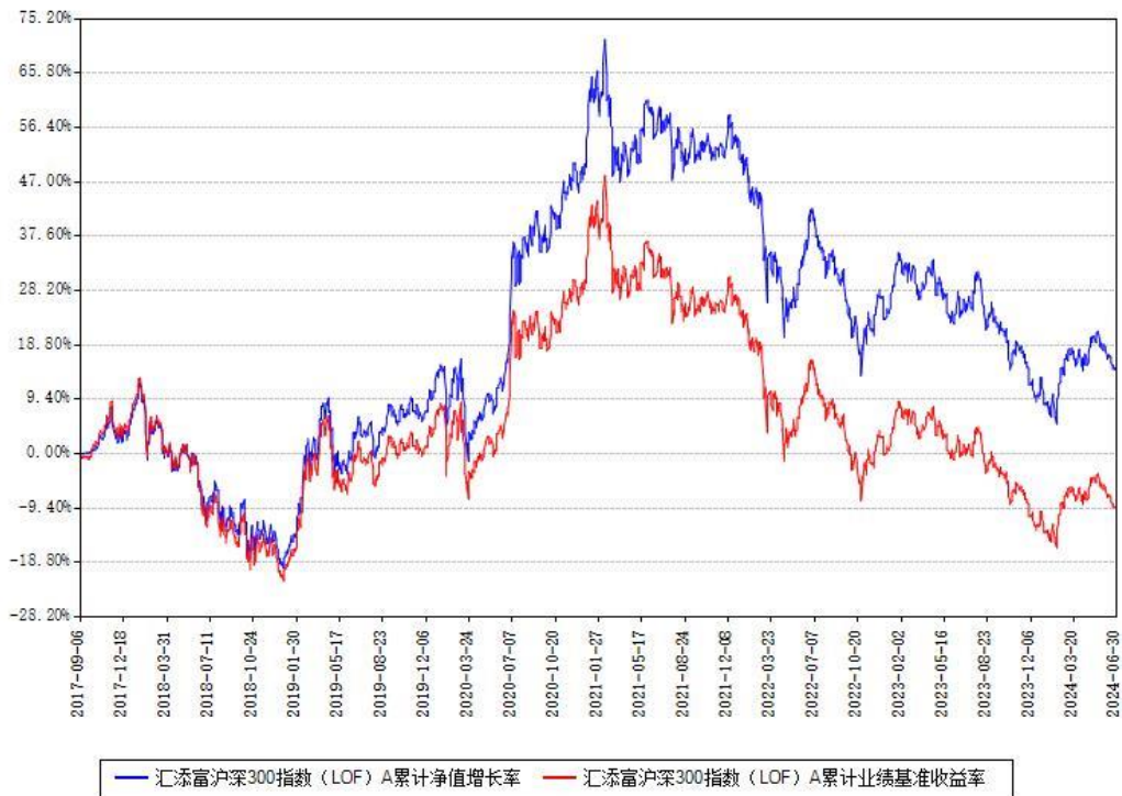
汇添富沪深300指数 (LOF) A 累计净值增长率与同期业绩基准收益率对比图