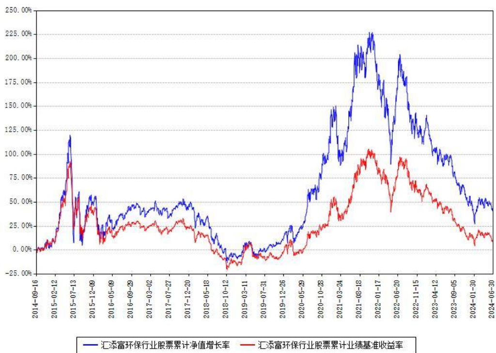
汇添富环保行业股票累计净值增长率与同期业绩基准收益率对比图