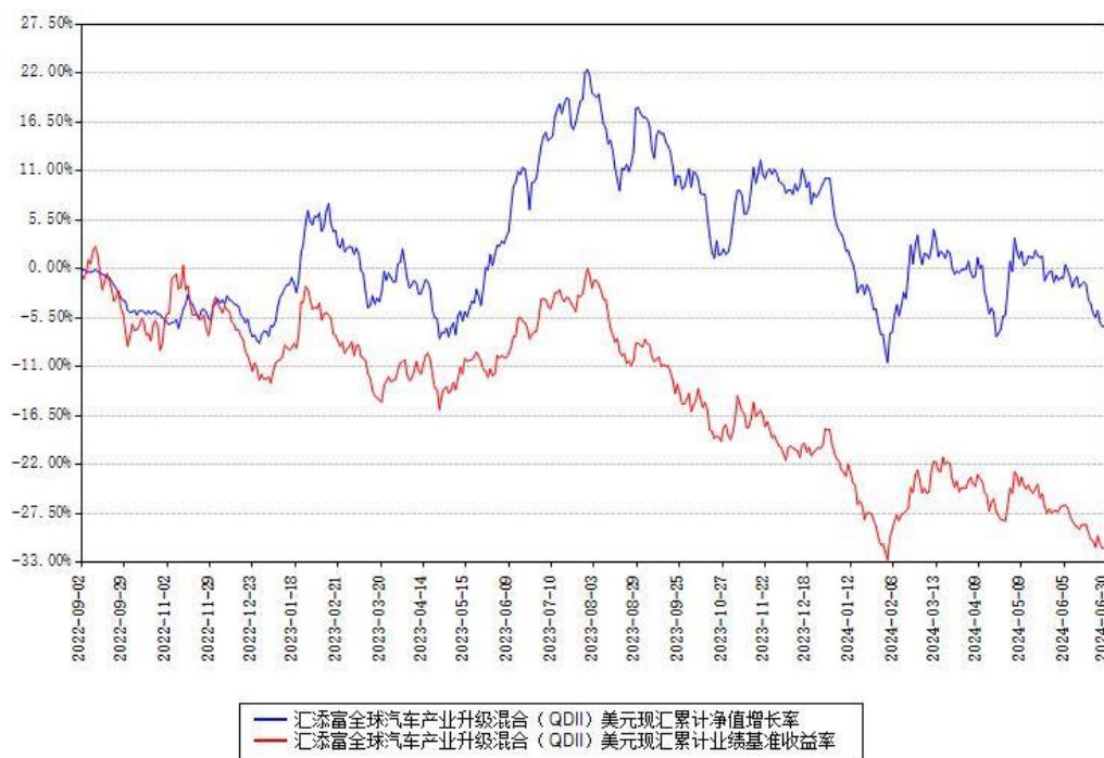
汇添富全球汽车产业升级混合（QDII）美元现钞累计净值增长率与同期业绩基准收益率对比图