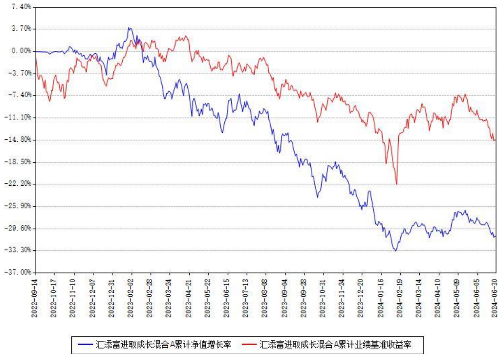
汇添富进取成长混合A累计净值增长率与同期业绩基准收益率对比图