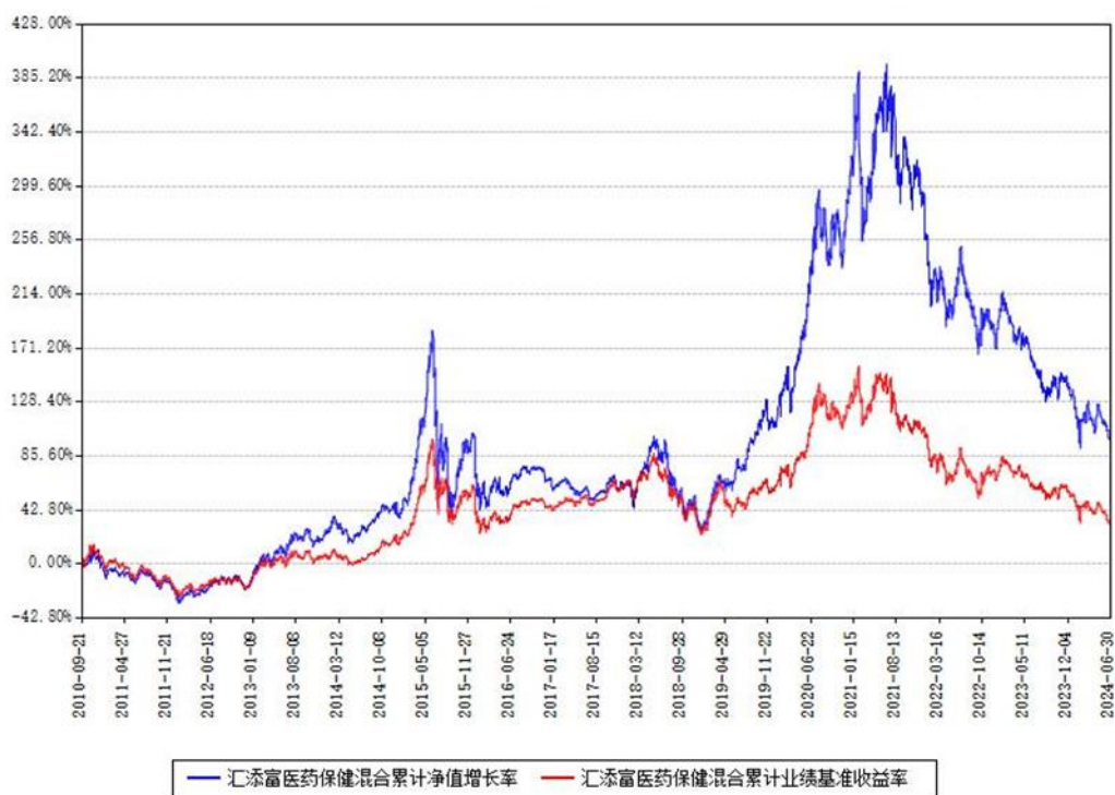
汇添富医药保健混合累计净值增长率与同期业绩基准收益率对比图

(二)自基金合同生效以来基金累计净值增长率变动及其与同期业绩比较基准收益率变动的比较图