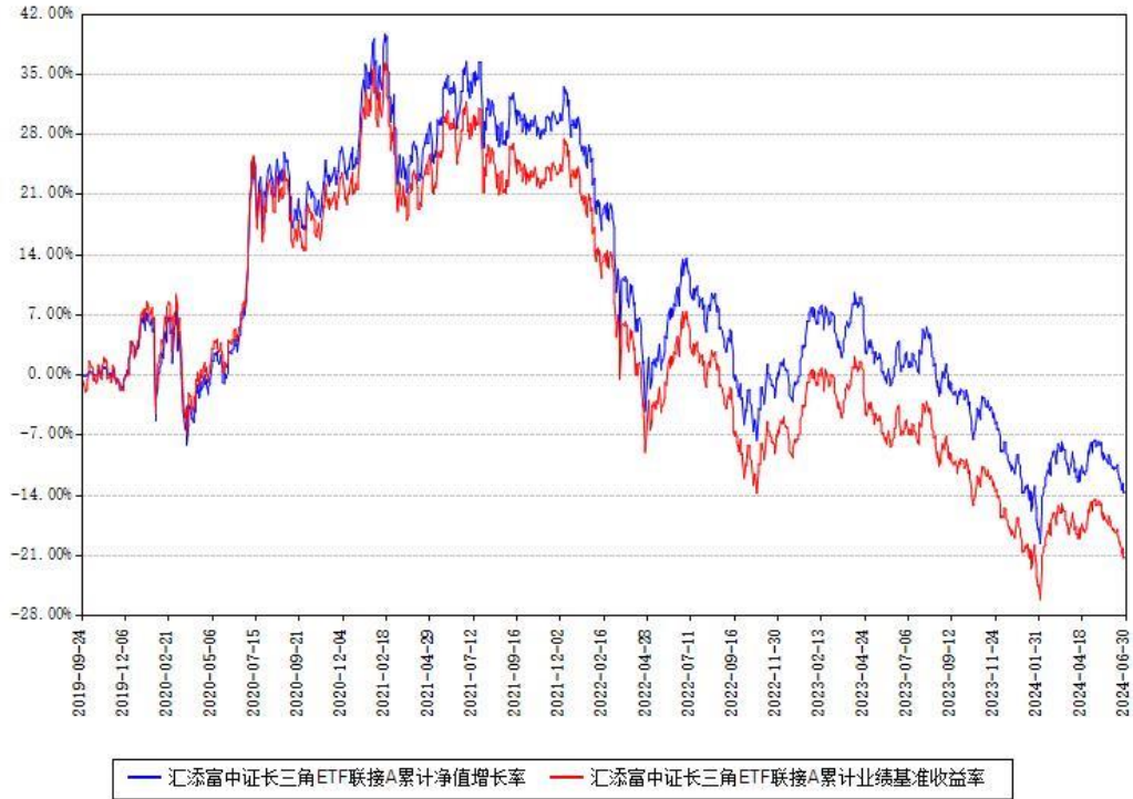
汇添富中证长三角ETF联接A累计净值增长率与同期业绩基准收益率对比图