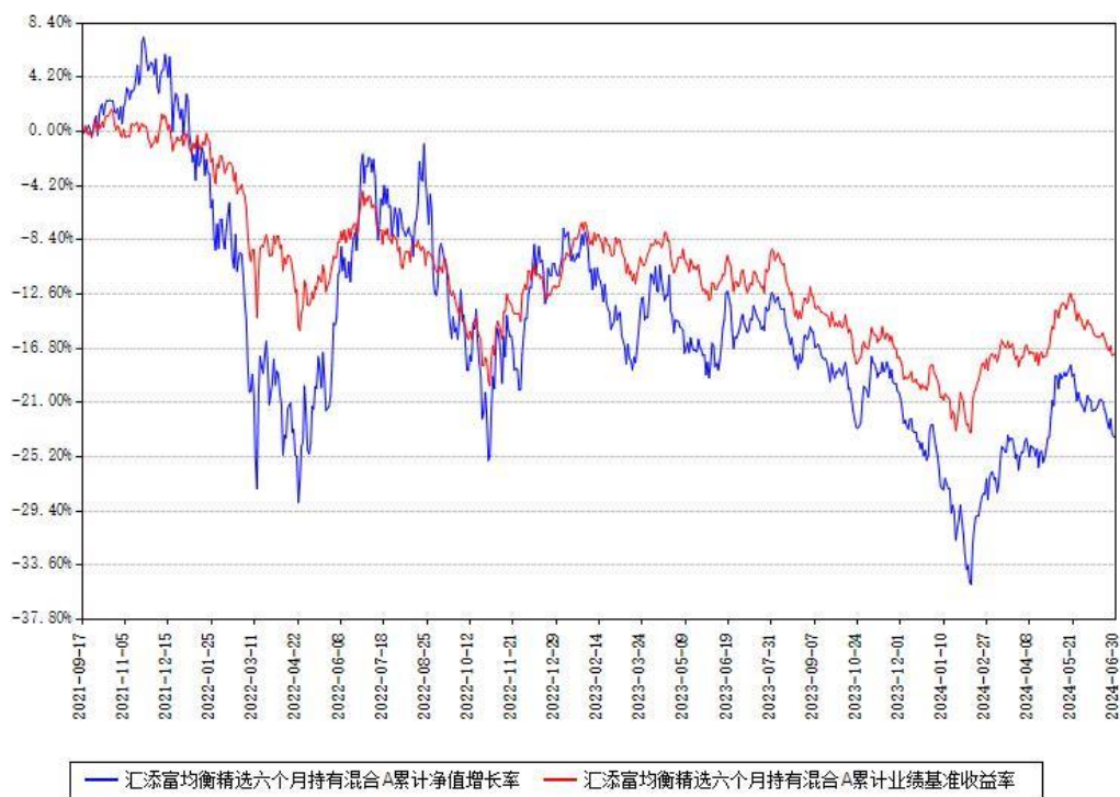
汇添富均衡精选六个月持有混合A累计净值增长率与同期业绩基准收益率对比图