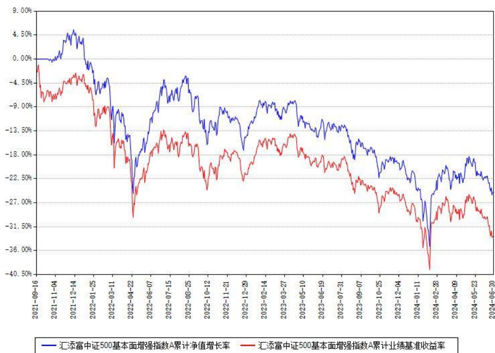
汇添富中证500基本面增强指数A累计净值增长率与同期业绩基准收益率对比图