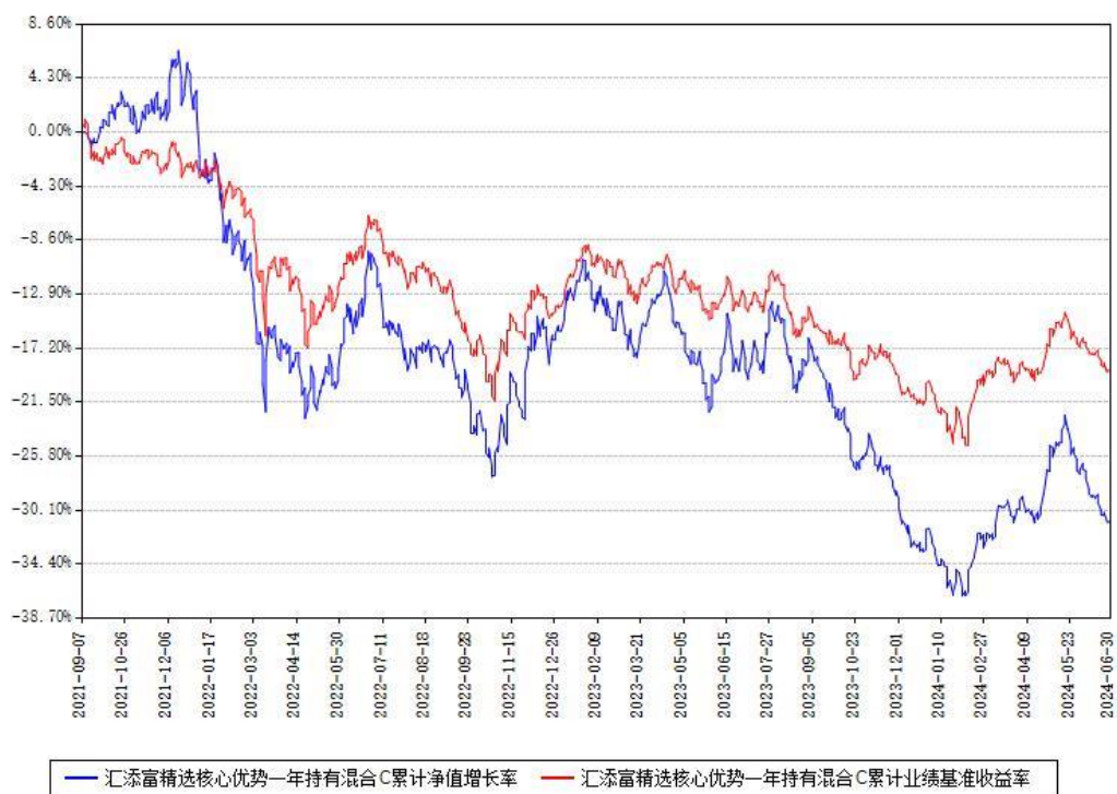
汇添富精选核心优势一年持有混合C累计净值增长率与同期业绩基准收益率对比图